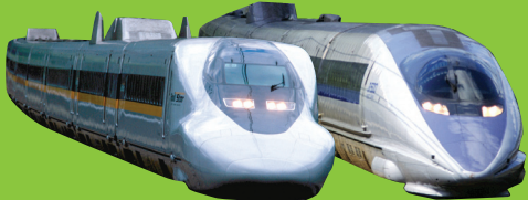
※700系新幹線(左)500系新幹線(右)(イメージ H)